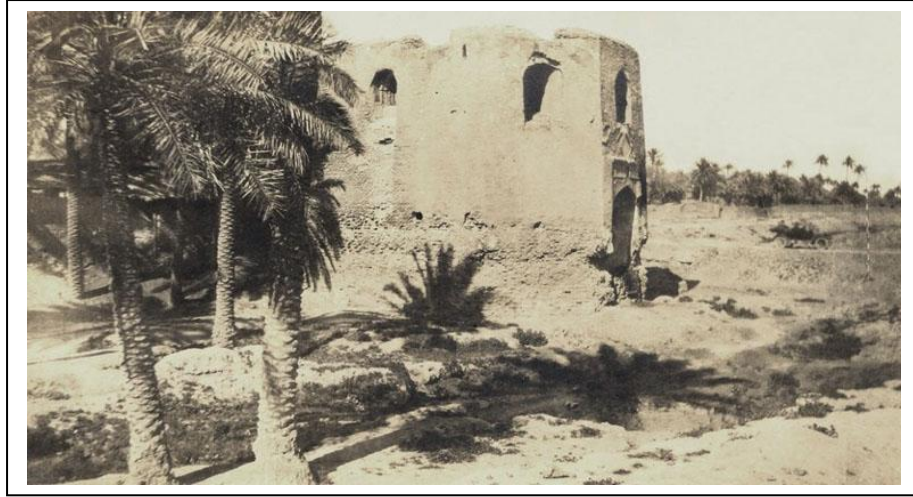
Bab Al-Sharqi, Baghdad, 1900

تاسعاً- تنظيم وأدارة الوحدات الباطنيه والعصبيه في المستشفى التعليمي