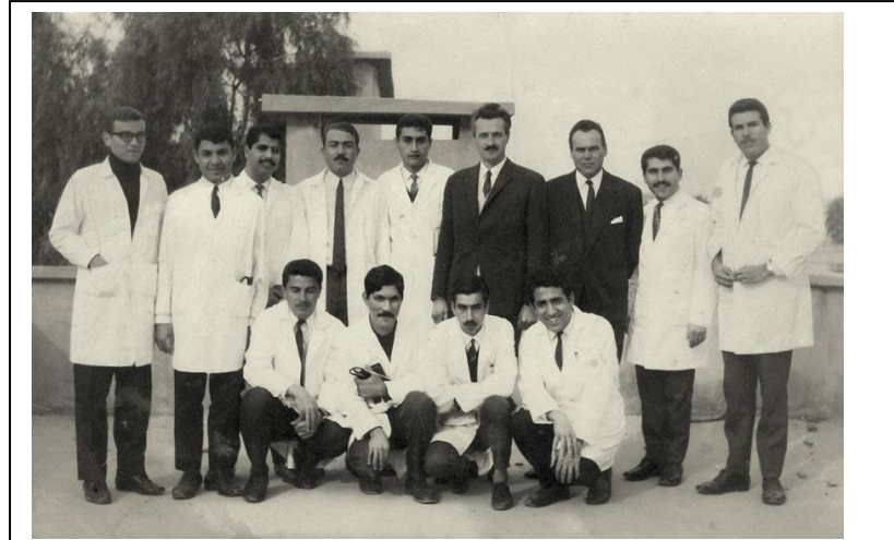
Medical Students Mosul Medical College 1968/9

ثامناً- ألقاء محاضرات في الامراض العصبية لطلبة الدراسات العليا في الدوره التحضيريه لامتحان الأختصاص في الكليات أملكيه البريطانيه.