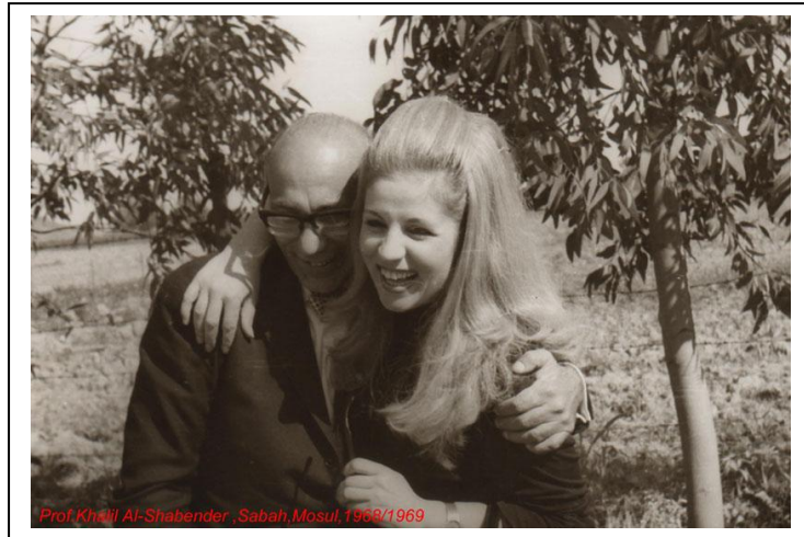
Prof.Khalil Al-Shabender ,Sabah,Mosul,1968/1969

أتقدم بالشكر الجزيل والامتنان الى الاستاذ فؤاد حسن غالي لتقديمه كافة النصائح والأرشادات وتشجيعه المتواصل بالإضافة الى تزويده الصور النادره في كتابة تاريخ العراق الطبي وأساتذته في هذه المقاله وغيرها.