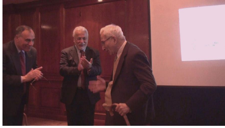
Prof.Shkara after Memorial Lecture,IMSI Meeting 2010

واصل نشاطه التدريسي والعلمي حيث تم ترقيته في عام 1969 ألى رئيس قسم الطب الباطني في الكليه الطبيه في الموصل وبقي في هذا المنصب حتى أنتقاله الى بغداد في 1978.