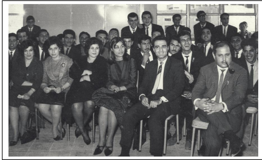
Medical Meeting Mosul Medical College 1968

ثلاثه عشر- عضو جمعية طب وجراحة الامراض العصبيه في أسبانيا.