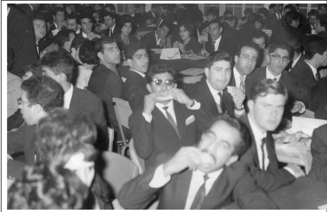
Mosul College Festival Day, 1968/9

ثمانيه عشر- تقديم دراسه مفصله عن أعمال ومنجزات القسم مدعّمًا بأاحصائيات وألارقام وطبعها في كتاب يقدم الى الجهات العليا في الوزاره والجامعه