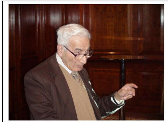
Prof.Shkara speech, IMSI 2010 London

وبالرغم من تقادم السنين ,فقد أعيد تعيينه في جامعة بغداد سنة 2005 ولكنه تقدم بطلب أحواله على التقاعد سنه 2006