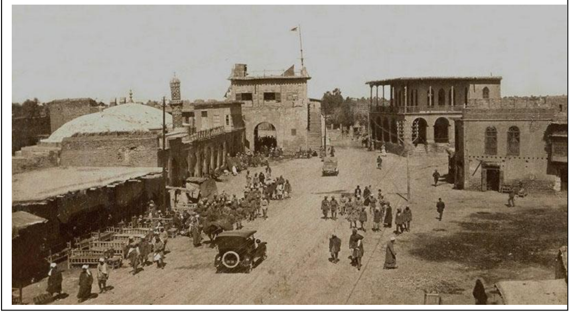
Bab Al-Mu'dhum, North Gate, Baghdad, 1918

وفي نفس الوقت أستمّر نشاطه العلمي في عدد من الجمعيات الطبيه والمهنيه بصفته عضواً، أميناً عاماً ورئيساً للجمعية الطبيه العراقيه، كذلك نائب رئيس جمعية الهلال الاحمر العراقيه وجمعية مكافحة السرطان، بالإضافة الى كونه أول رئيس لجمعية تنظيم الاسره وجمعية الخصوبه العراقيه.