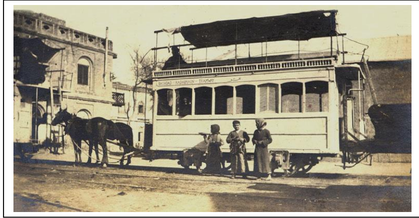
Baghdad-Kadhimian Nafar, Horse Tramway, 1920

كذلك قام بتنظيم ندوه وتحت إشراف منظمة الصحة العالميه حول تنظيم الاسره وعلاقتها بصحة الاطفال وألتي أقيمت في بغداد في تشرين الاول 1971